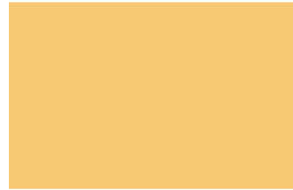
Yellow Tulip 228C Tulipán Amarillo