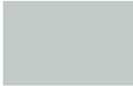
Newbury Gray 418B Gris Newbury