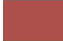
Pepper & Spice 236F Pimienta y Especies