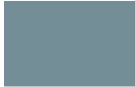
Prunella 313E Prunella