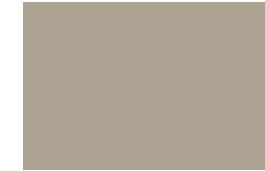
Hawk Gray 401C Gris Halcón