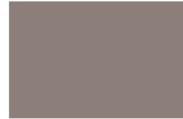
Revere Greige 403E Crudo