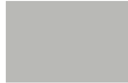
Livingsten Grey 409C Gris Livingsten